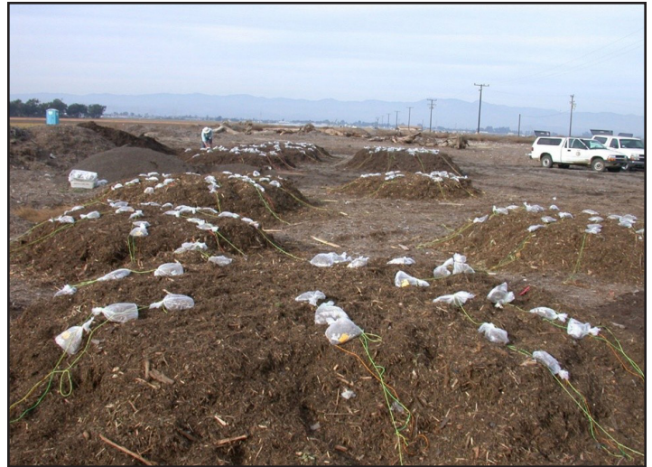
Figura 3. Las investigaciones sobre estudios de inóculo enterrado muestran que los patógenos sobreviven muy poco en acolchados frescos de astillas de madera.