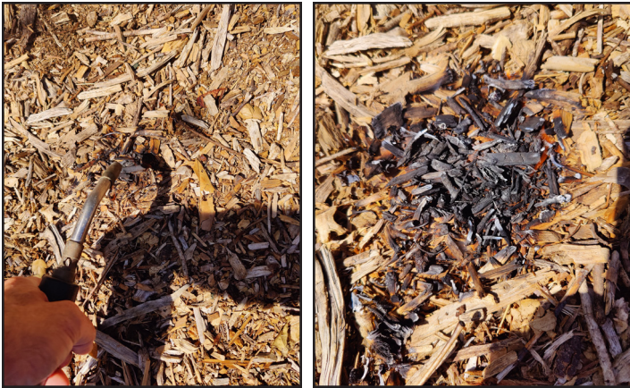
Figura 7. Las astillas de madera de arboricultura no se queman fácilmente ni siquiera cuando se exponen a llamas directas (izquierda); el único resultado es el carbonizado (derecha).