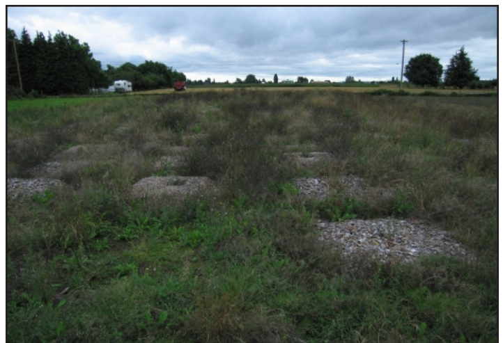
Figura 6. Un año después de la instalación del acolchado, las malezas han cubierto el área excepto donde las astillas de madera son más profundas (8-12 pulgadas).