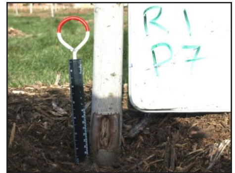
Figura 4. Los arces con heridas (izquierda) fueron cubiertos con acolchado de astillas de madera de arborista (centro) o se dejaron expuestos (derecha). No se encontró ninguna enfermedad en ninguno de los árboles estudiados. Sin embargo, el cierre de las heridas fue generalmente mayor cuando se cubrieron con astillas de madera de arborista (Giblin, 2021).