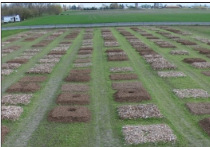
Figura 5. Mantillos de astillas de madera recién instalados a diferentes profundidades durante la investigación de campo. Un solo árbol se encuentra en el centro de cada parcela.