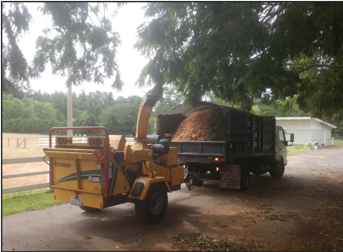
Figura 2. Entrega de astillas de madera por parte de un servicio local de arboricultura.